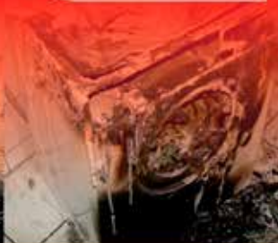
Ha tűz van, hívja a 112-es számot!