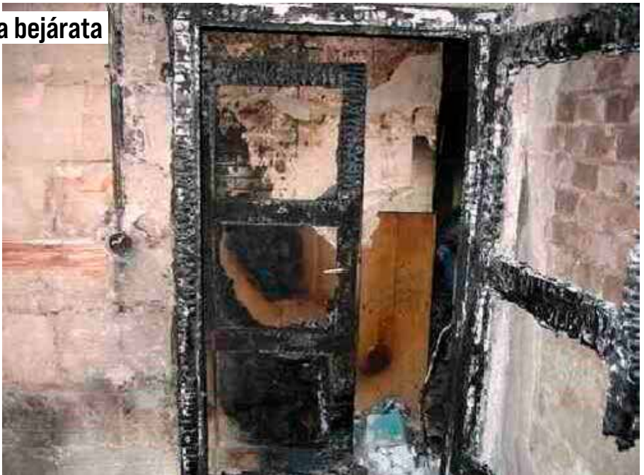
...és a bejárata