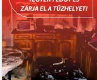
Ha tűz van, hívja a 112-es számot!