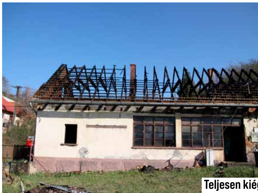
Teljesen kiégett és leégett lakóépület