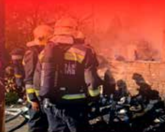
Ha tűz van, hívja a 112-es számot!