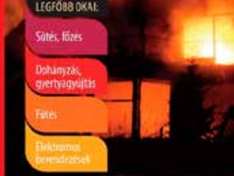
Ha tűz van, hívja a 112-es számot!