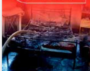
Ha tűz van, hívja a 112-es számot!